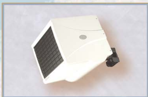
TERMOVENTILATORI fino a 12Kw