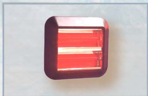
RISCALDATORI ALOGENI per grandi aree e spazi aperti

per informazioni telefonare al 030-9361875 oppure scrivere a tecnico@elettrogamma.com