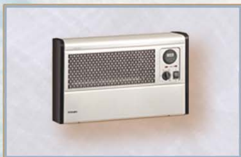
TERMOCONVETTORI fino a 3Kw